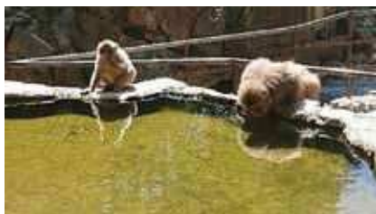
温泉のまわりのニホンザル

5月の某日、久しぶりに長野県北部へ出かけてきました。昔はスキーなどで、冬のシーズンに4、5回は長野方面へ出かけていましたが、最近は体力の衰えもあり雪山へ行くこともなく、久方ぶりに長野方面へ足を延ばすこととなりました。